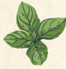
ΒΑΣΙΛΙΚΟΣ ΣΤΟ ΑΥΤΙ