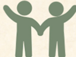
ΠΑΡΟΥΣΙΑ 2 ΑΤΟΜΩΝ